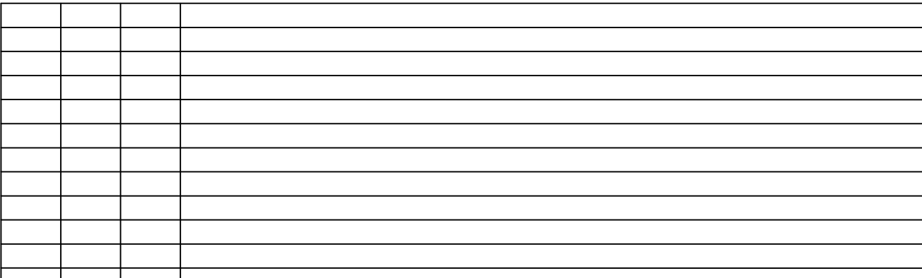
DE08.2: Schlosserarbeiten Geländerabwicklung C-C' | M 1:20